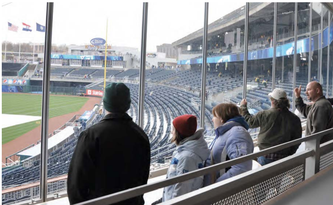
Estadio Kauffman, USA.